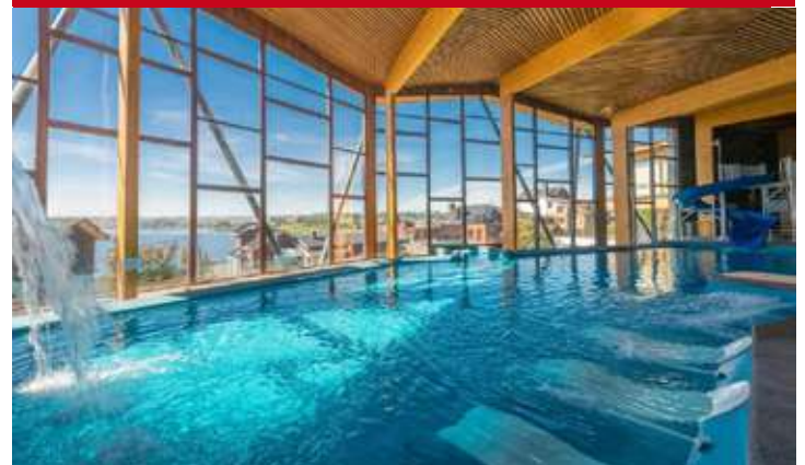
Cabañas del Lago