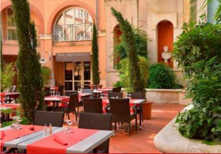
Plaza Capicole Toulouse