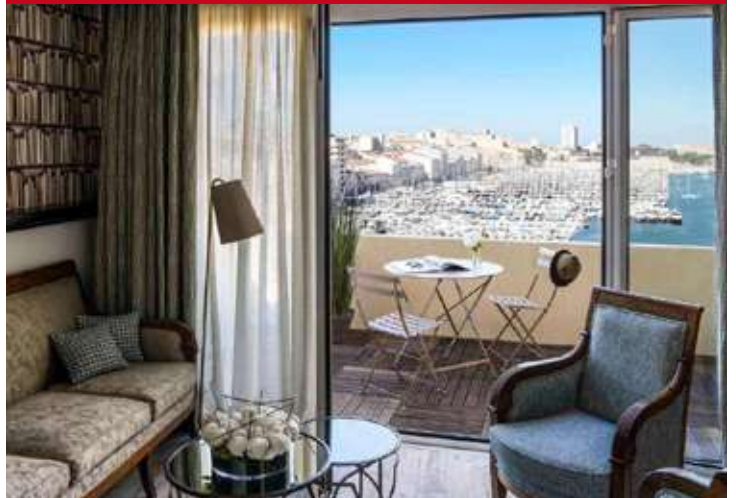
MGallery Grand Hotel Beauvau