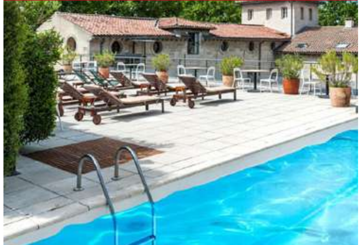
Cloitre Saint Louis