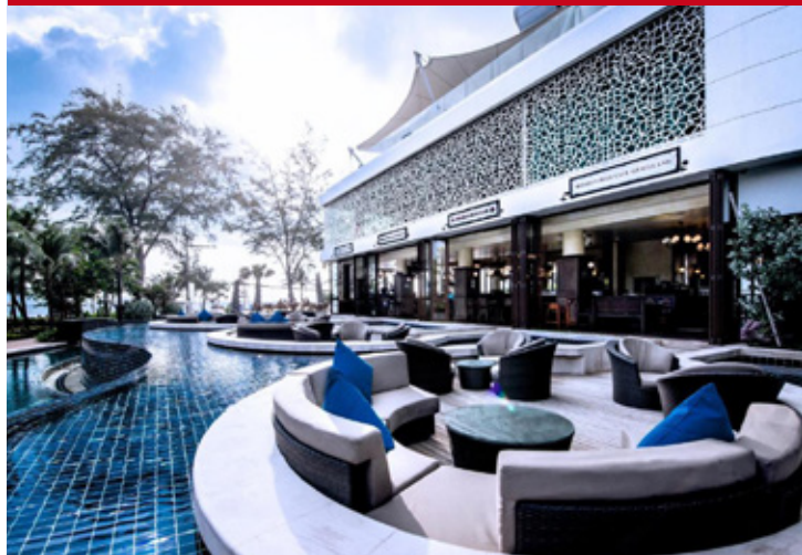
Graceland & Spa