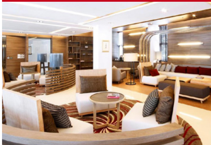
Classic Kameo Ayuthaya