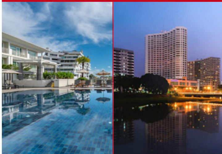
Kantary Hills ou Centara Riverside